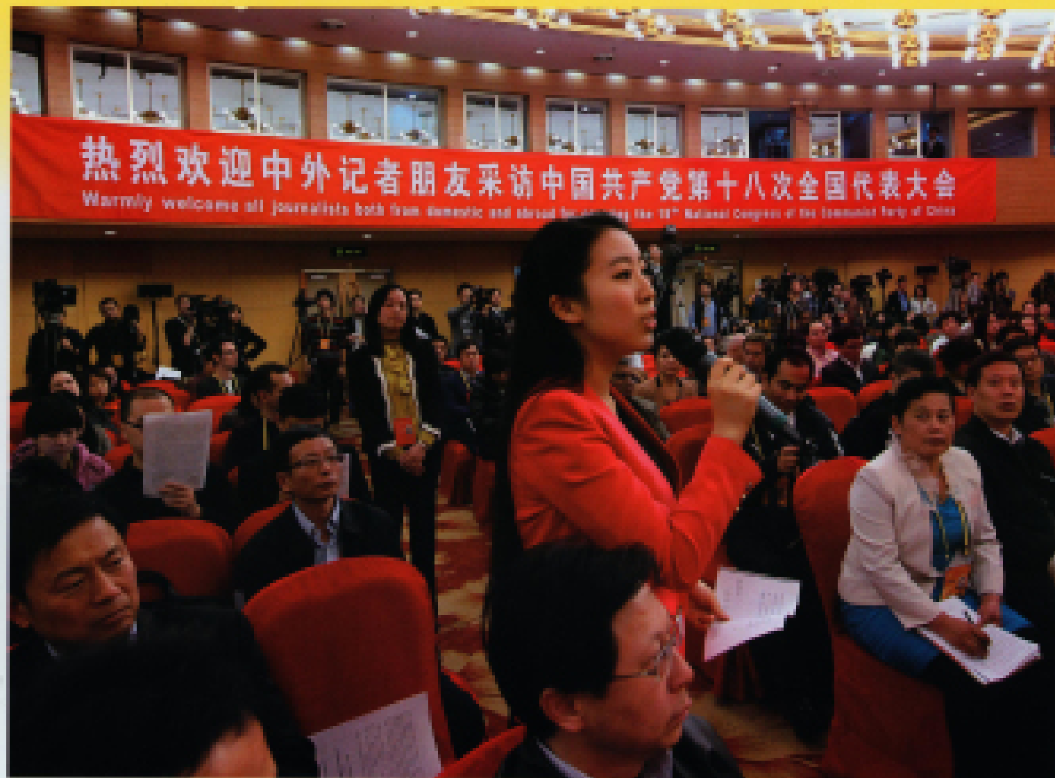
▲ 2012年11月9日,十八大新闻中心在梅地亚中心二楼多功能厅举办记者招待会,邀请中共中央组织部副部长王京清介绍党的建设工作,并回答中外记者提问。图为招待会现场一名记者提问。