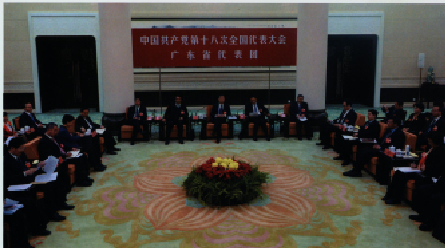
▲ 2012年11月9日,广东代表团讨论十八大报告。