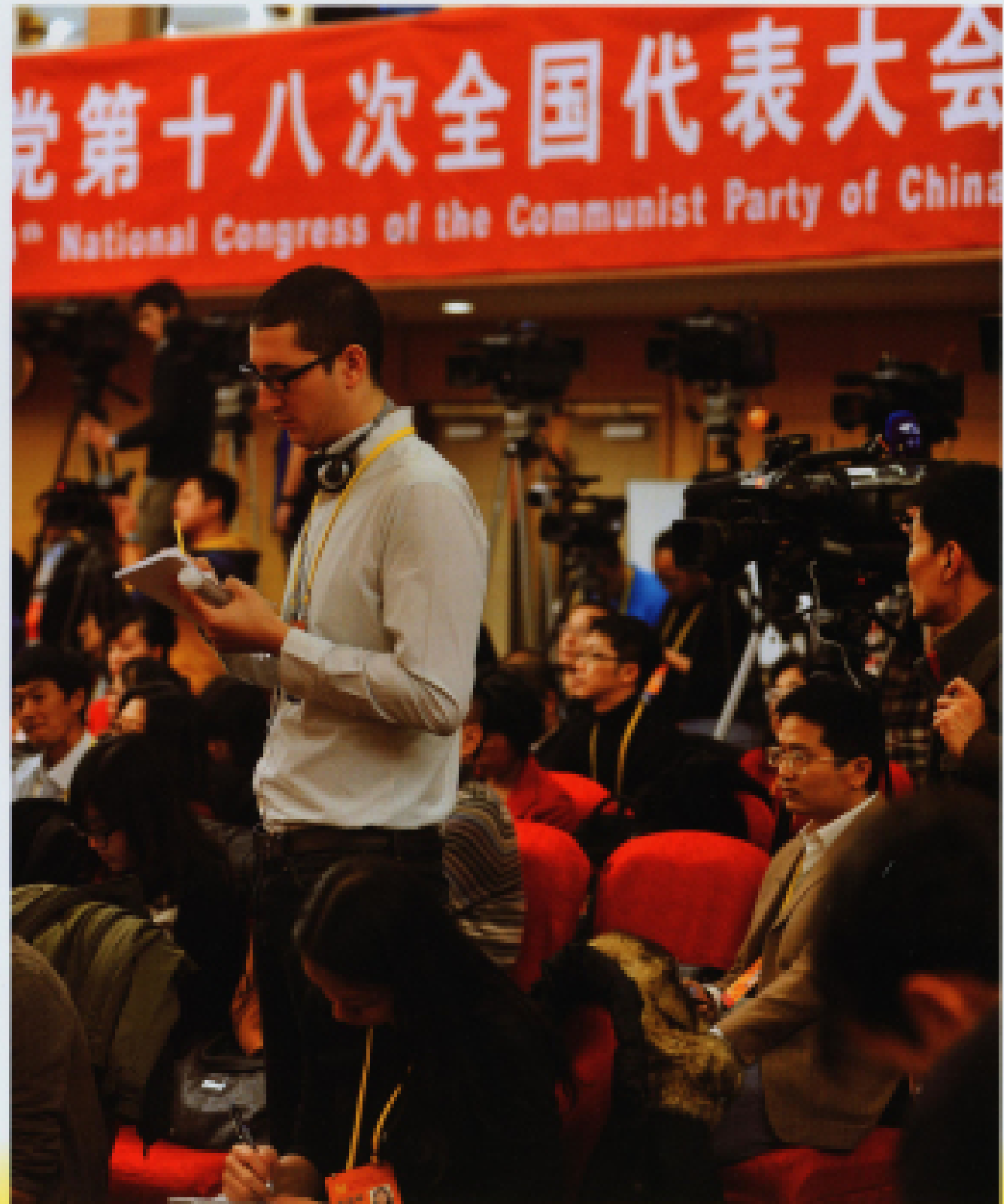
▲ 2012年11月12日,十八大新闻中心举行记者招待会。现场一外籍记者提问。