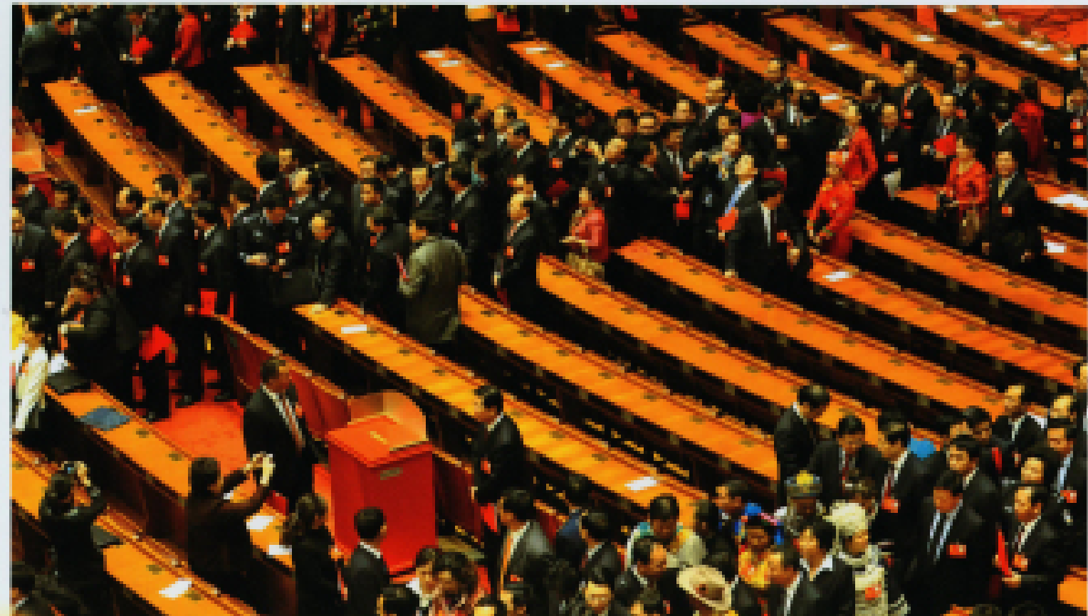
▲ 2012年11月14日,出席中国共产党第十八次全国代表大会代表在北京人民大会堂投票,选举中央委员会委员、候补委员和中央纪律检查委员会委员。