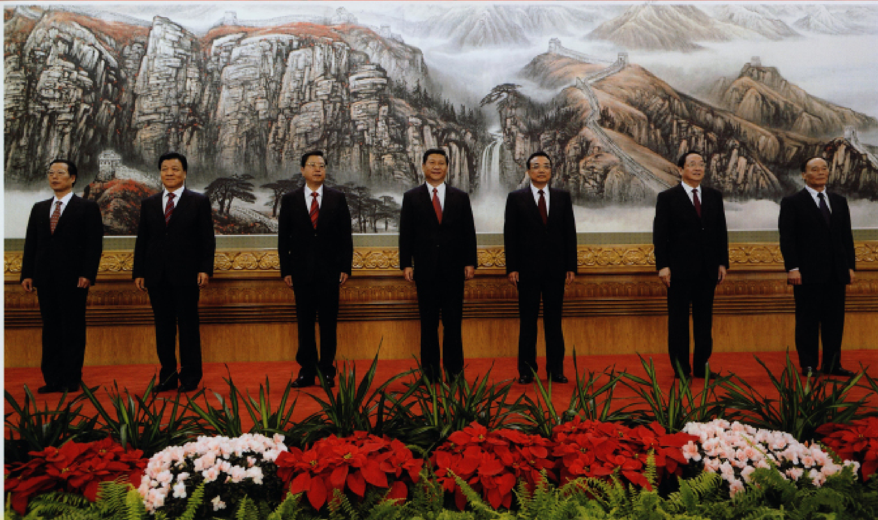
▲ 11月15日,新当选的中共中央总书记习近平和中共中央政治局常委李克强、张德江、俞正声、刘云山、王岐山、张高丽在北京人民大会堂与中外记者见面。