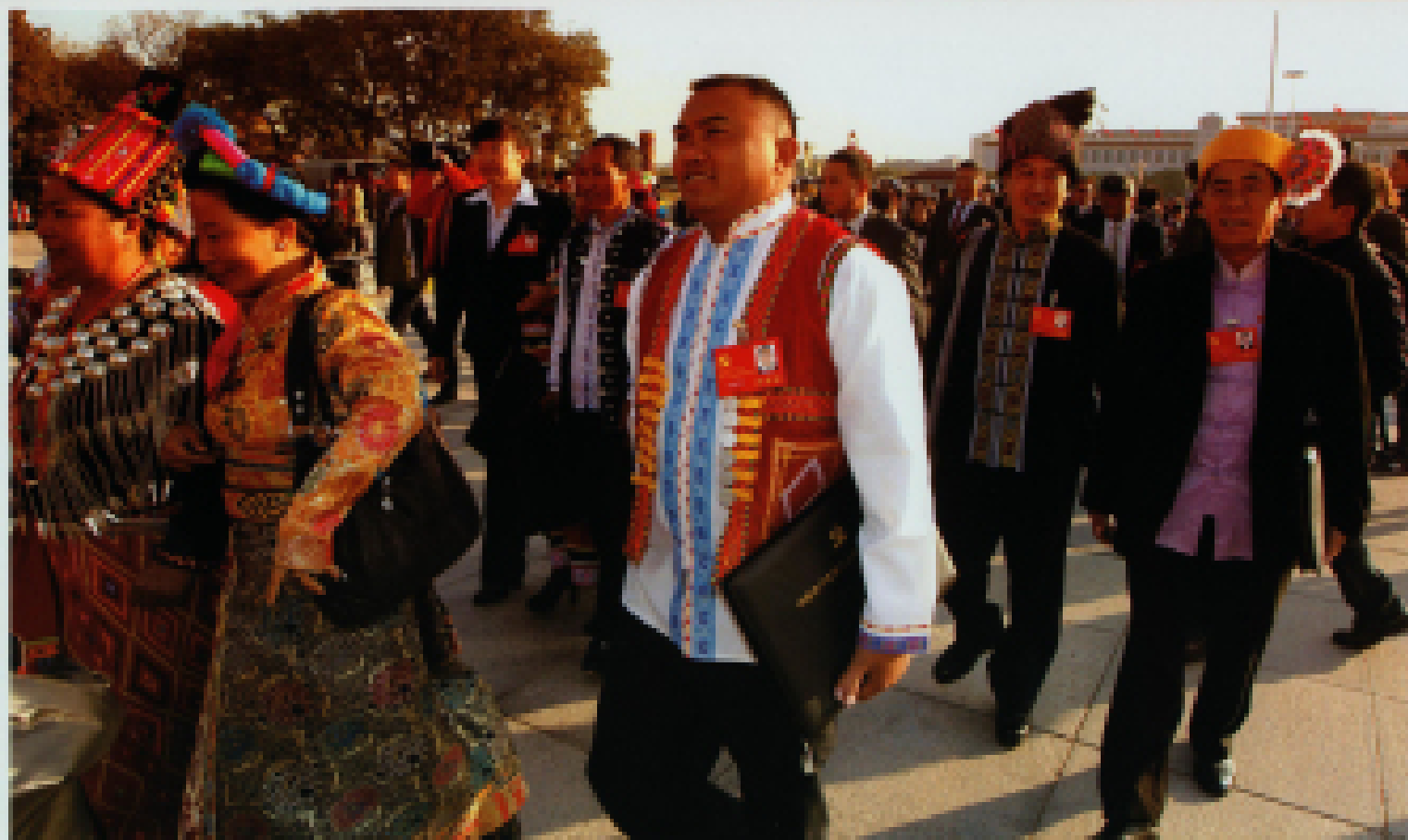
◀ 2012年11月8日,中国共产党第十八次全国代表大会在北京人民大会堂召开。各民族代表精神振奋,意气风发赴盛会。