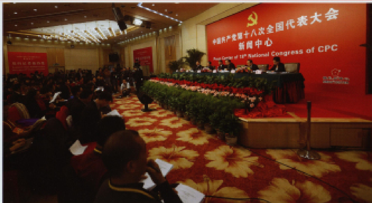
◀ 2012年11月12日,十八大新闻中心举行中外记者招待会,住房和城乡建设部部长、党组书记姜伟新,国家发展和改革委员会副主任、党组副书记朱之鑫,环境保护部部长、党组书记周生贤,人力资源和社会保障部副部长、党组副书记杨志明介绍中国民生领域工作情况,并回答记者提问。