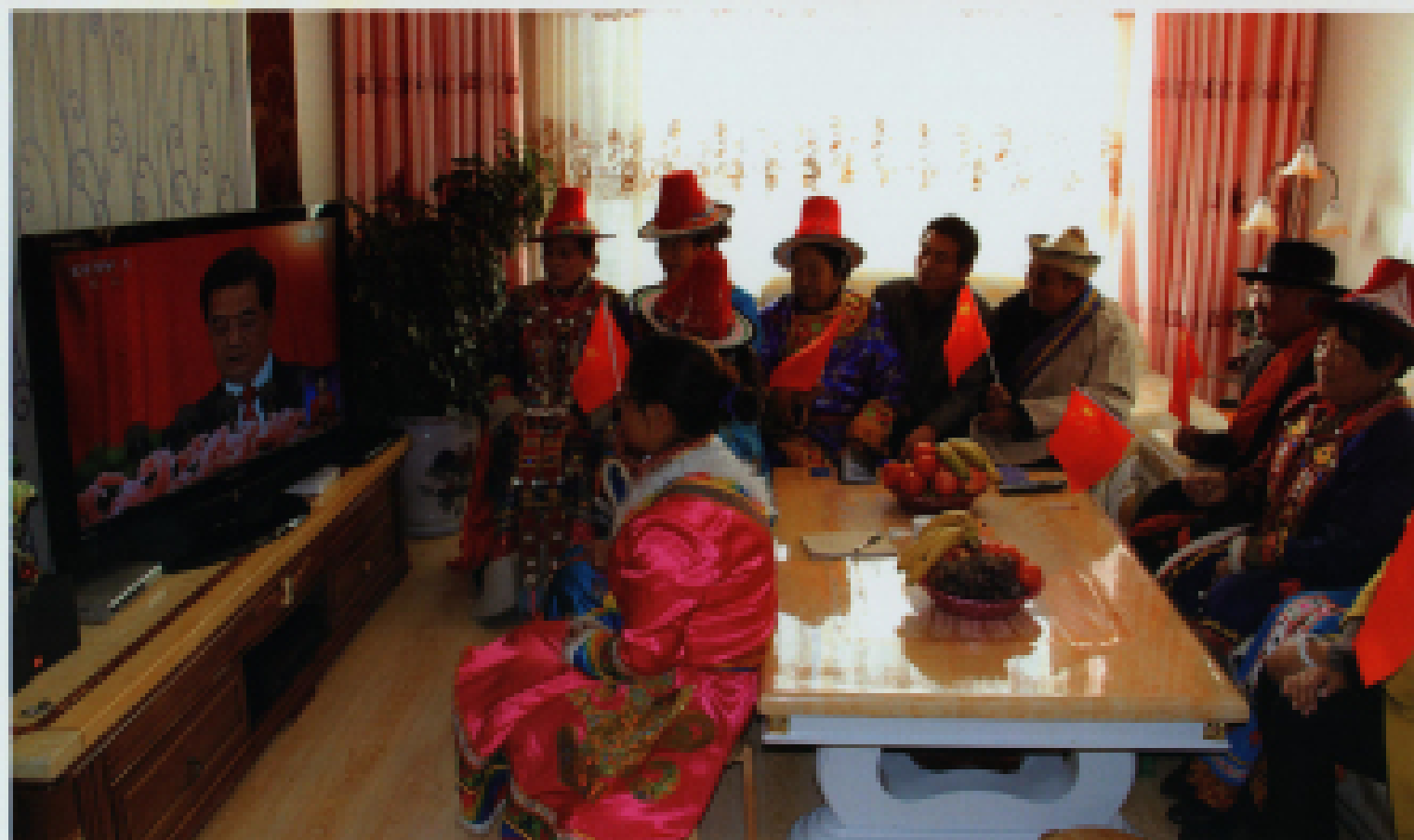
◀ 2012年11月8日,甘肃省肃南裕固族自治县群众观看中国共产党第十八次全国代表大会开幕式电视直播。