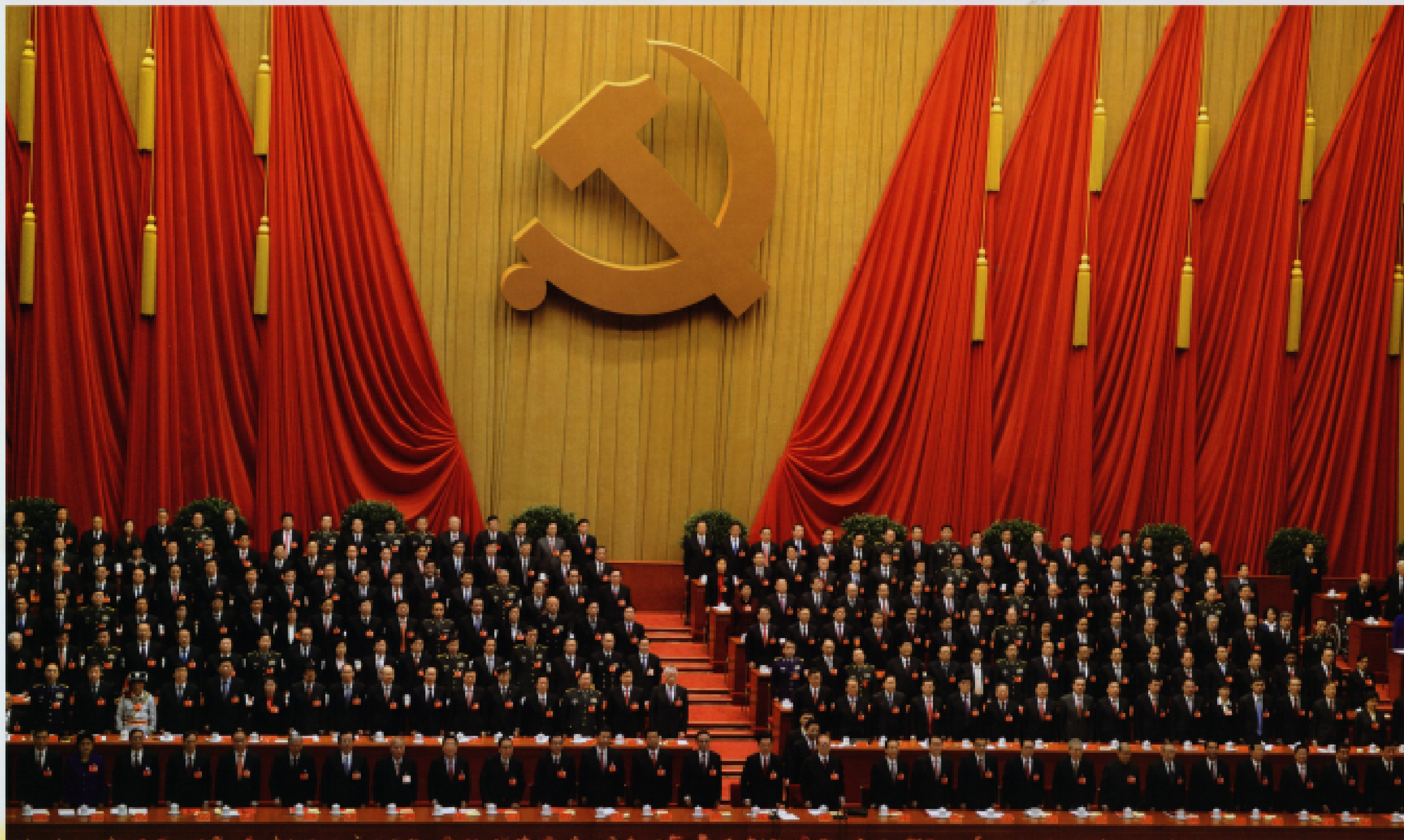
▲ 2012年11月14日,中国共产党第十八次全国代表大会在北京人民大会堂举行闭幕会。全体与会者唱国际歌。