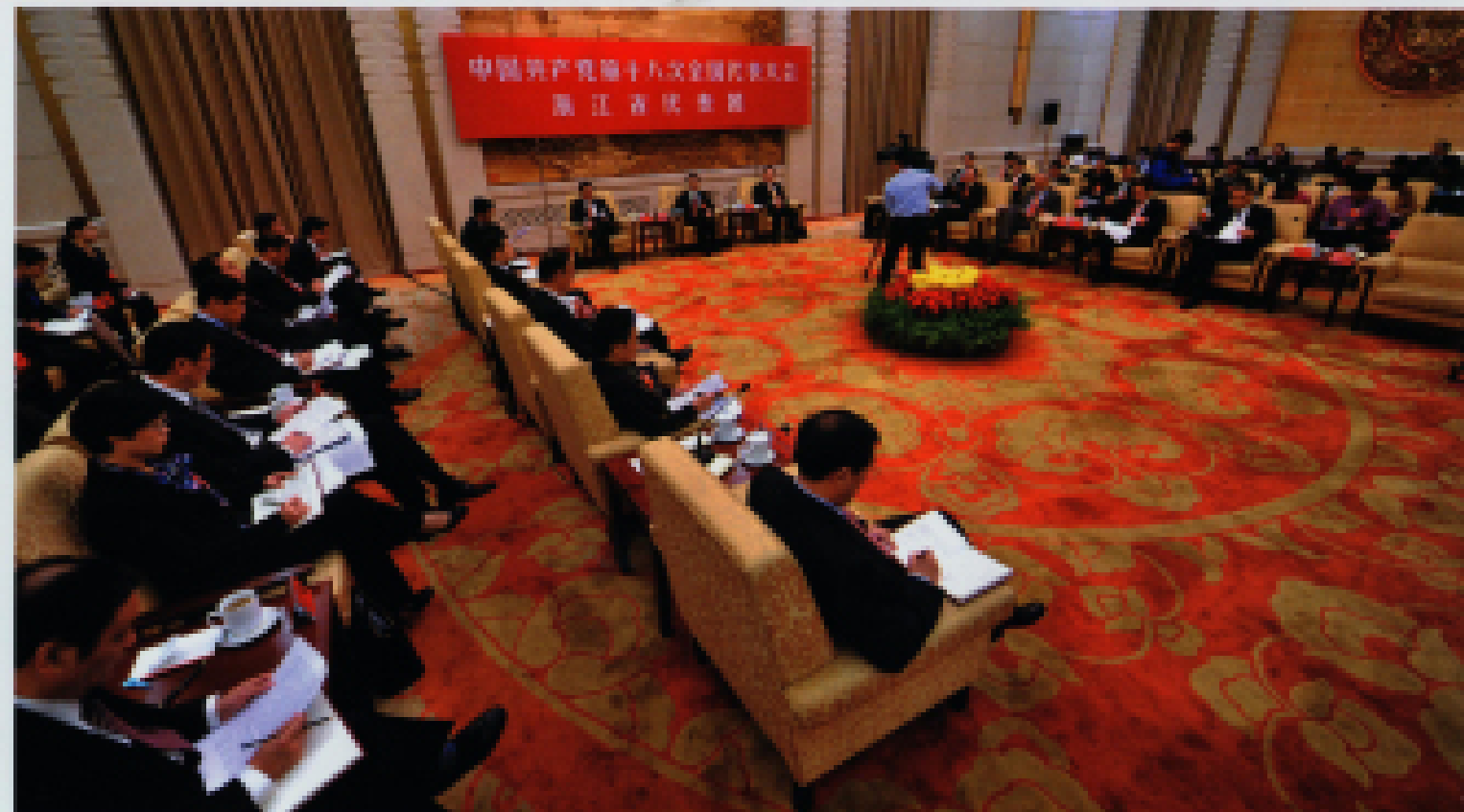
▲ 2012年11月9日,浙江代表团讨论十八大报告。