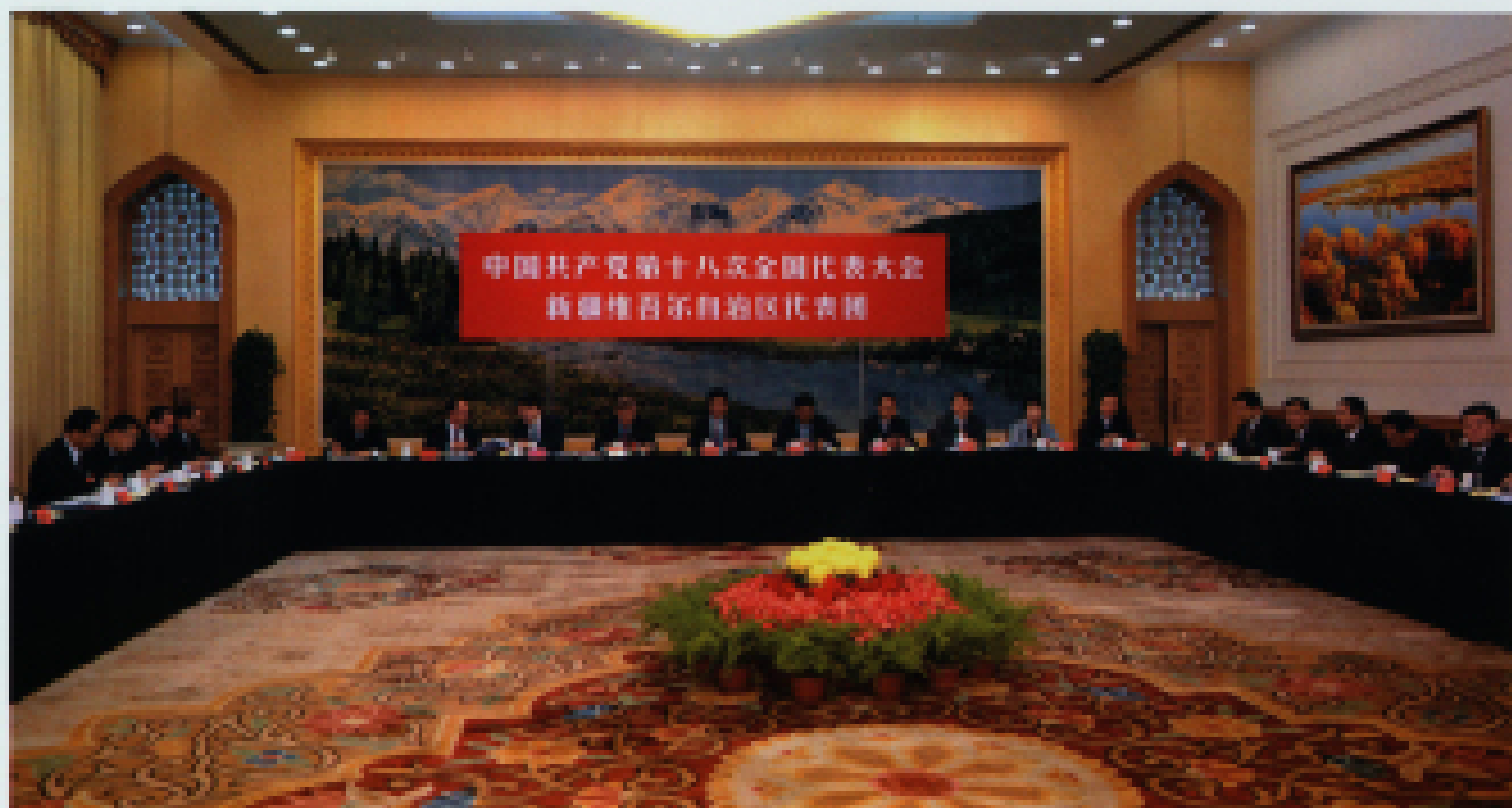
▲ 2012年11月9日,新疆代表团讨论十八大报告。