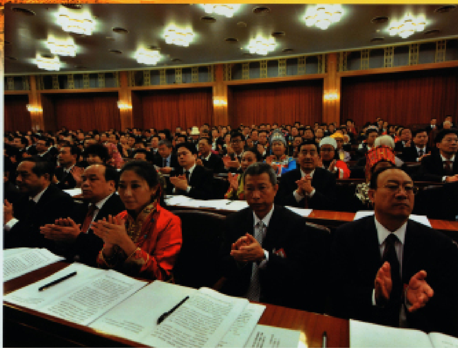
▲ 2012年11月8日,中国共产党第十八次全国代表大会在北京人民大会堂隆重开幕,与会代表热烈鼓掌。