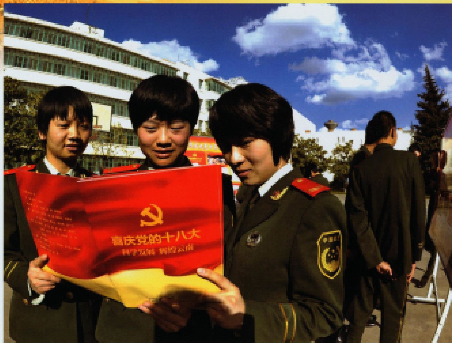
▲ 2012年11月12日,官兵们在观看《科学发展 辉煌云南》系列展板。当日,武警云南总队依托云南省委宣传部制作的《科学发展 辉煌云南》画册,举办系列“喜庆党的十八大”展板活动,喜迎党的十八大胜利召开,让官兵亲身感悟云南多民族地区日新月异变化的同时,领悟十八大报告精神。