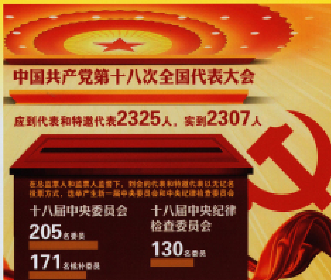
▲ 图表: 十八大选举产生中央委员会和中央纪律检查委员会。