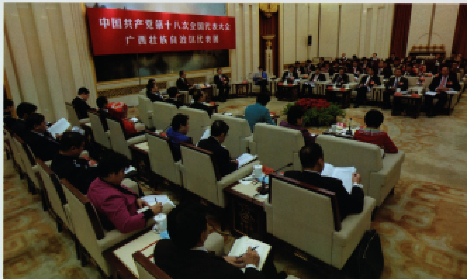
◀ 2012年11月8日,中国共产党第十八次全国代表大会在北京人民大会堂开幕,当日下午,广西代表团讨论大会报告。