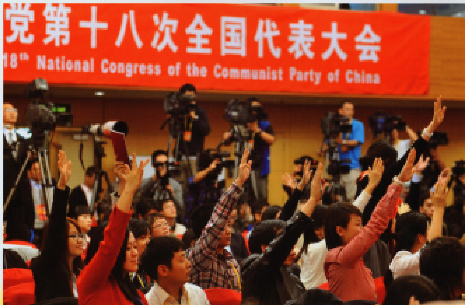
▲ 2012年11月12日,十八大新闻中心举行记者招待会。现场记者积极举手提问。