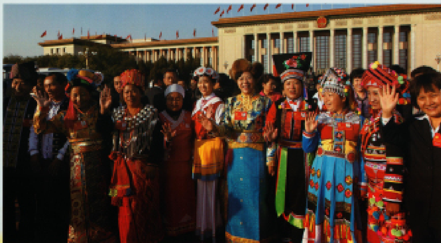
▲ 2012年11月8日,中国共产党第十八次全国代表大会在北京人民大会堂召开。图为少数民族代表在人民大会堂前合影。