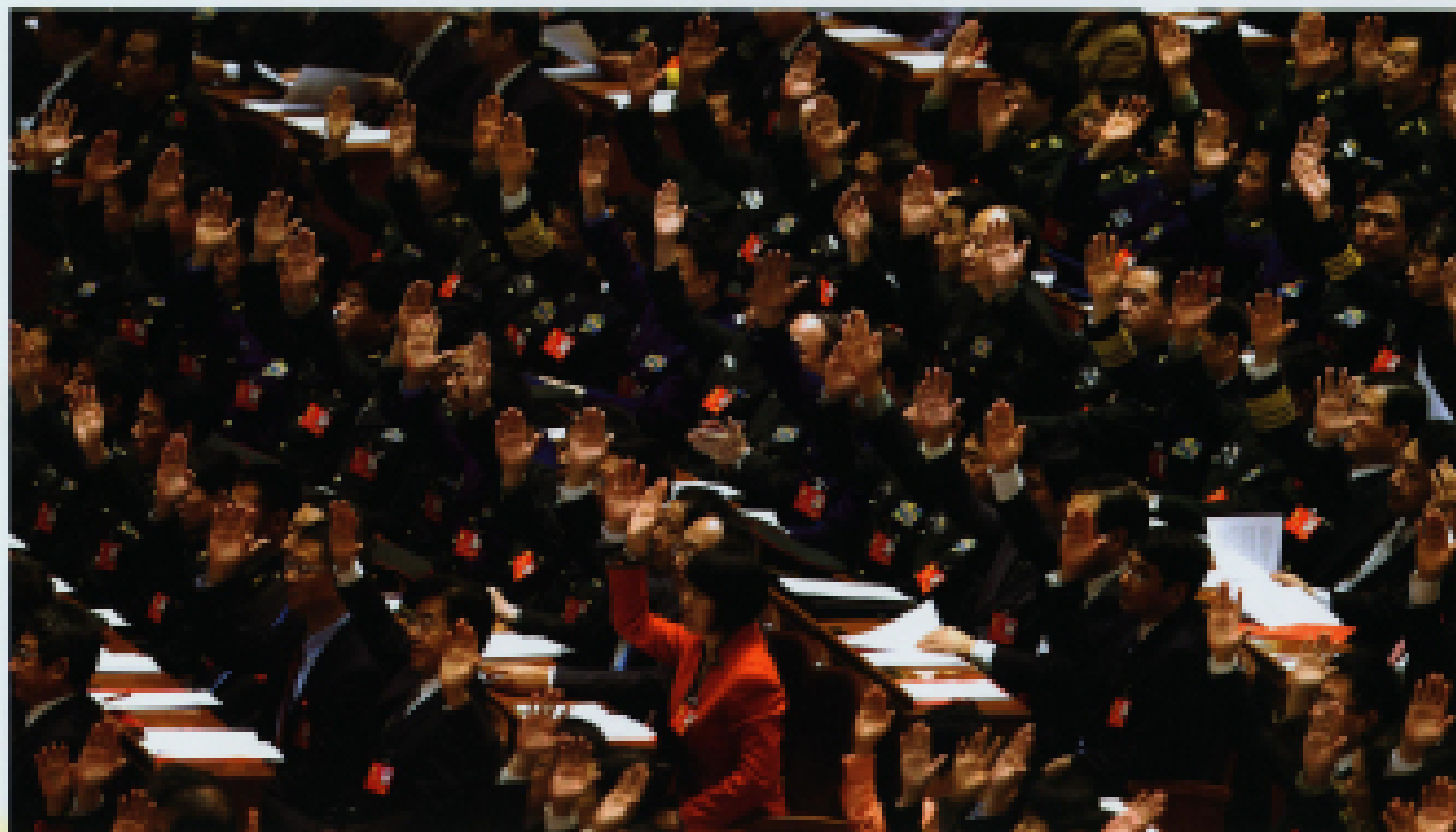
▲ 2012年11月14日,中国共产党第十八次全国代表大会闭幕会在北京人民大会堂举行。代表举手表决。