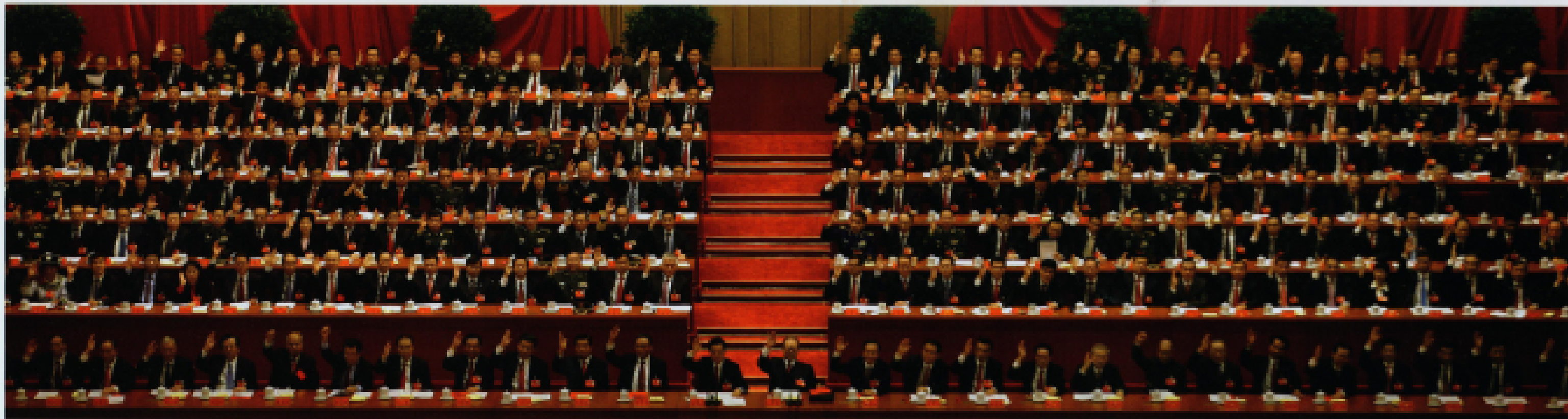
▲ 2012年11月14日,中国共产党第十八次全国代表大会闭幕会在北京人民大会堂举行。代表举手表决。