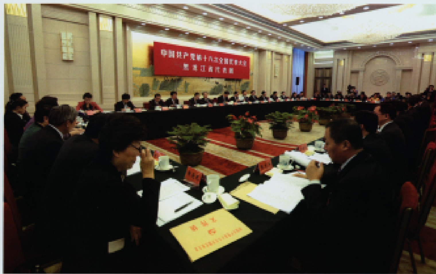
▲ 2012年11月8日,中国共产党第十八次全国代表大会在北京人民大会堂开幕,当日下午,黑龙江代表团讨论大会报告。