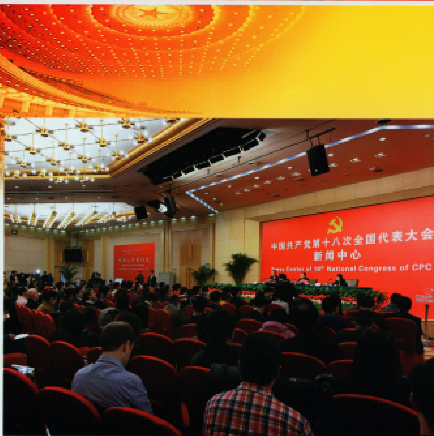
▲ 2012年11月9日,十八大新闻中心在梅地亚中心二楼多功能厅举办记者招待会,邀请中共中央组织部副部长王京清介绍党的建设工作,并回答中外记者提问。图为记者招待会场。