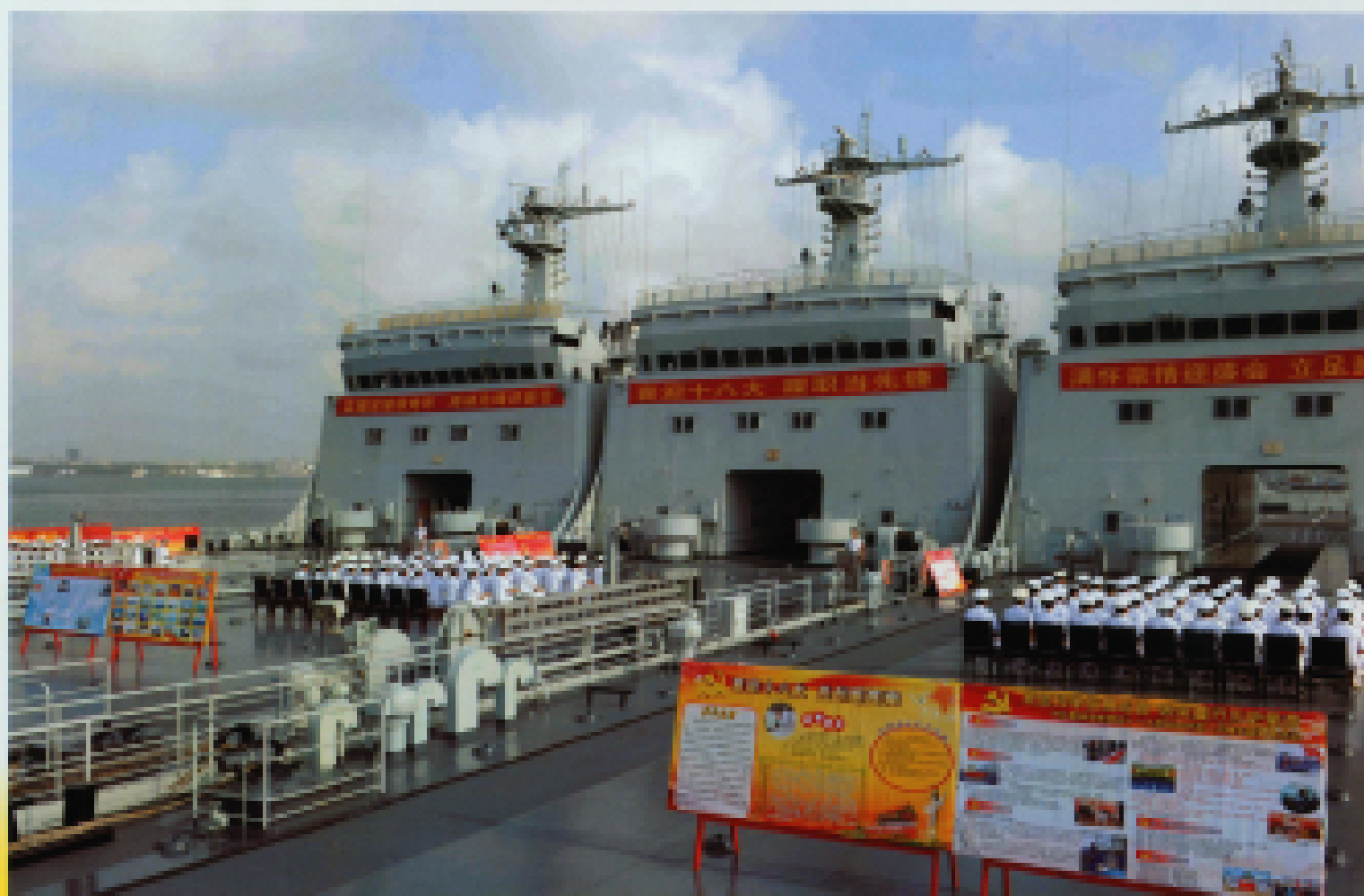
◀ 2012年11月8日,南海舰队某登陆舰队支队组织官兵集体收看十八大盛况。