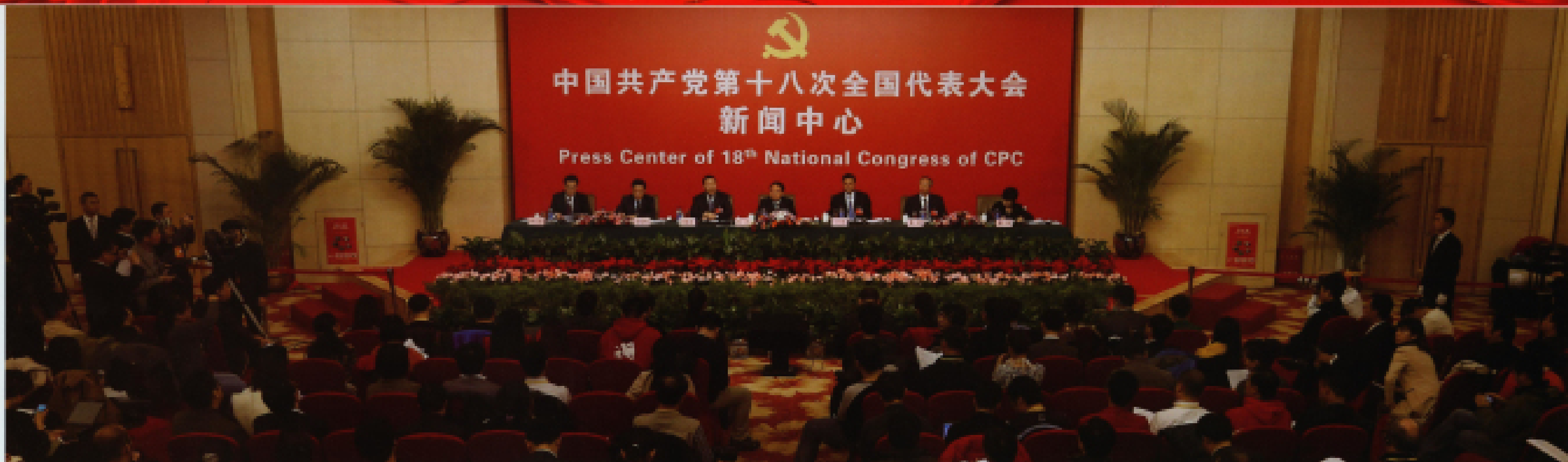
▲ 2012年11月10日,十八大新闻中心在梅地亚中心二楼多功能厅举办第二场集体采访活动,中国工程院院长、党组书记周济,中国航天科技集团公司总经理、党组书记马兴瑞,国家电网公司总经理、党组书记刘振亚,天津天地伟业数码科技有限公司总经理、党委书记戴林,三一重工股份有限公司董事长梁稳根接受采访。