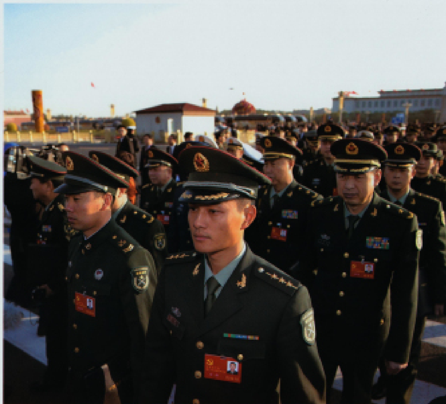
▲ 2012年11月8日,中国共产党第十八次全国代表大会在北京人民大会堂召开。图为解放军代表步入会场。