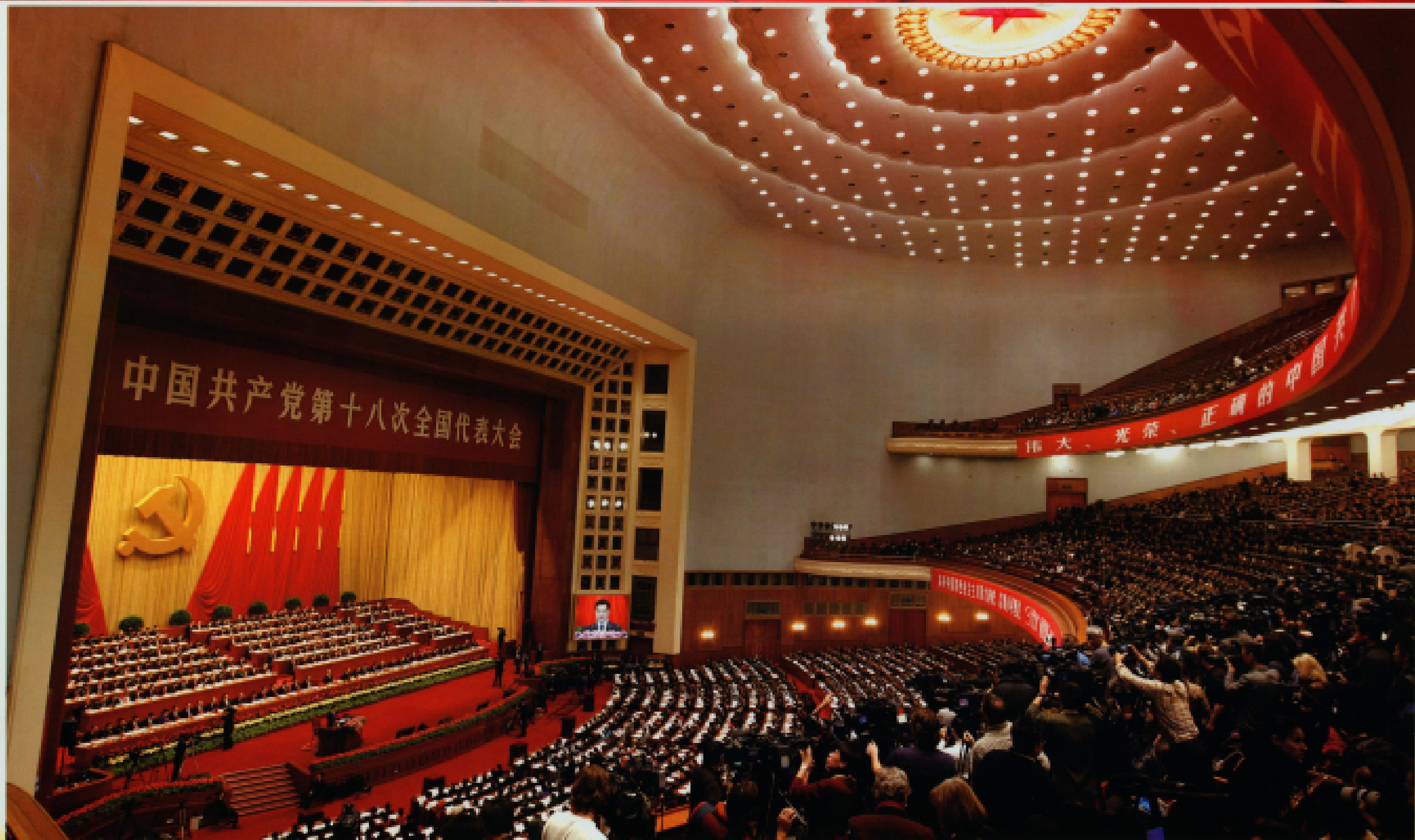
▲ 2012年11月8日,中国共产党第十八次全国代表大会在北京人民大会堂隆重开幕。胡锦涛、江泽民、吴邦国、温家宝、贾庆林、李长春、习近平、李克强、贺国强、周永康等出席大会并在主席台就座,吴邦国主持大会。胡锦涛向大会作题为《坚定不移沿着中国特色社会主义道路前进,为全面建成小康社会而奋斗》的报告。