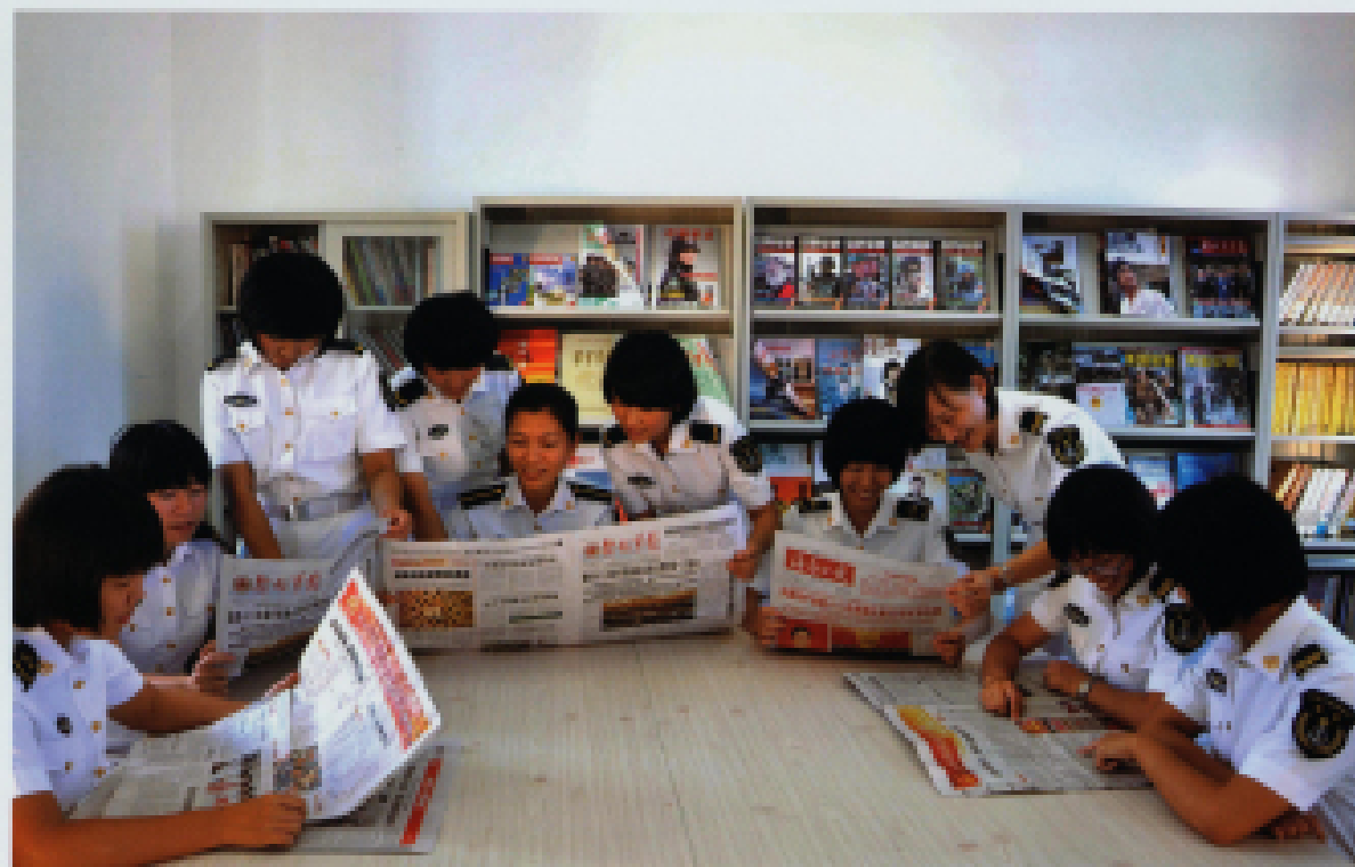
▲ 2012年11月9日党的十八大胜利召开喜讯传来,榆林基地某通信站三中队女兵连官兵备受鼓舞,她们积极学习宣传大会精神,深入组织班排开展了“庆盛会,话党恩”演讲比赛和“赞成就,看变化”科学发展辩论赛,还编排了系列文艺节目,从而激发了“天涯女兵”立足岗位建功立业的巾帼情怀。图为女兵们正在学习十八大精神。