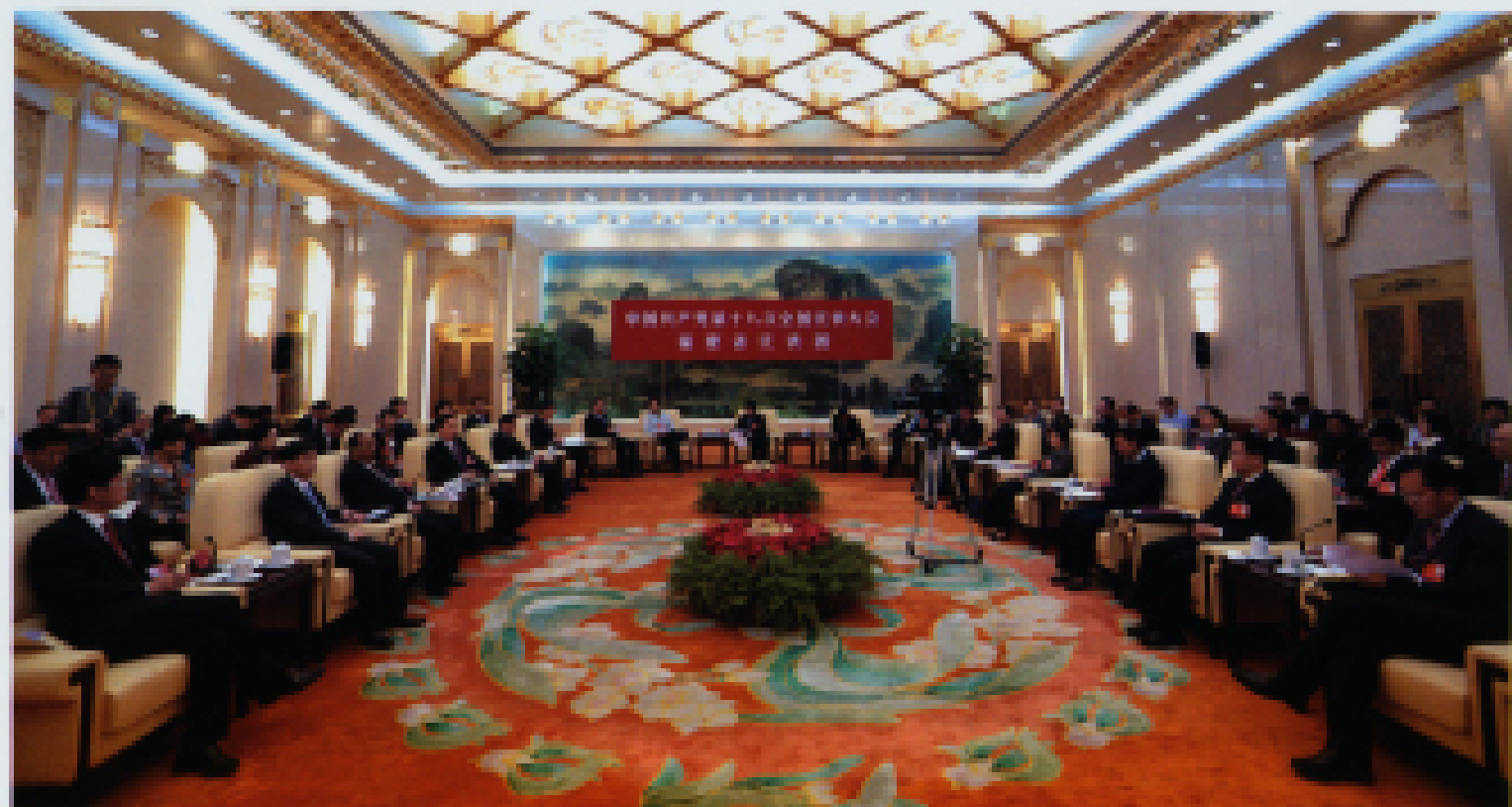
▲ 2012年11月9日,福建代表团讨论十八大报告。