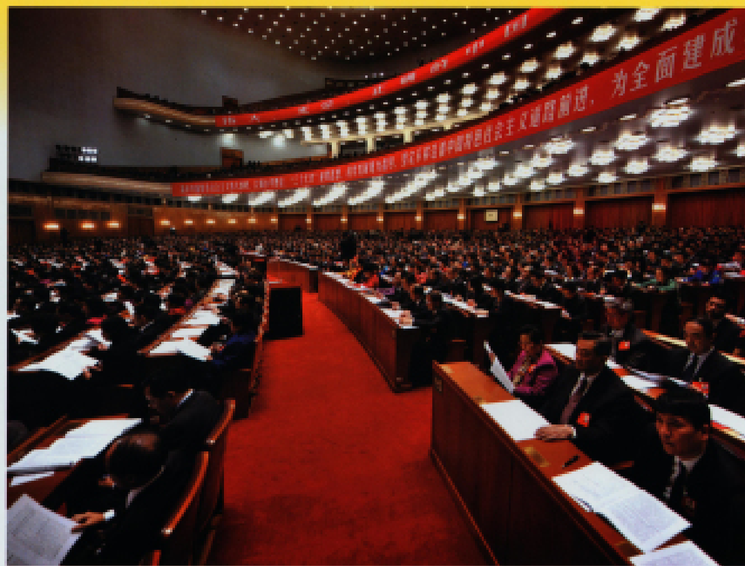
▲ 2012年11月8日,中国共产党第十八次全国代表大会在北京人民大会堂隆重开幕。图为大会会场。