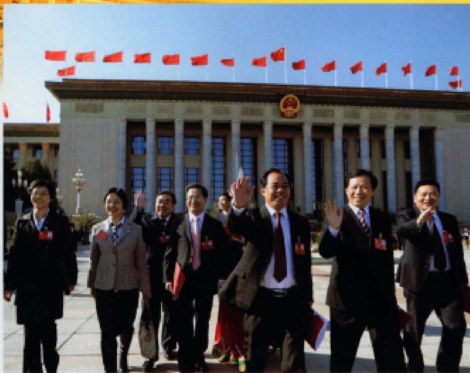
▲ 2012年11月14日,中国共产党第十八次全国代表大会在北京人民大会堂闭幕。图为代表走出人民大会堂。