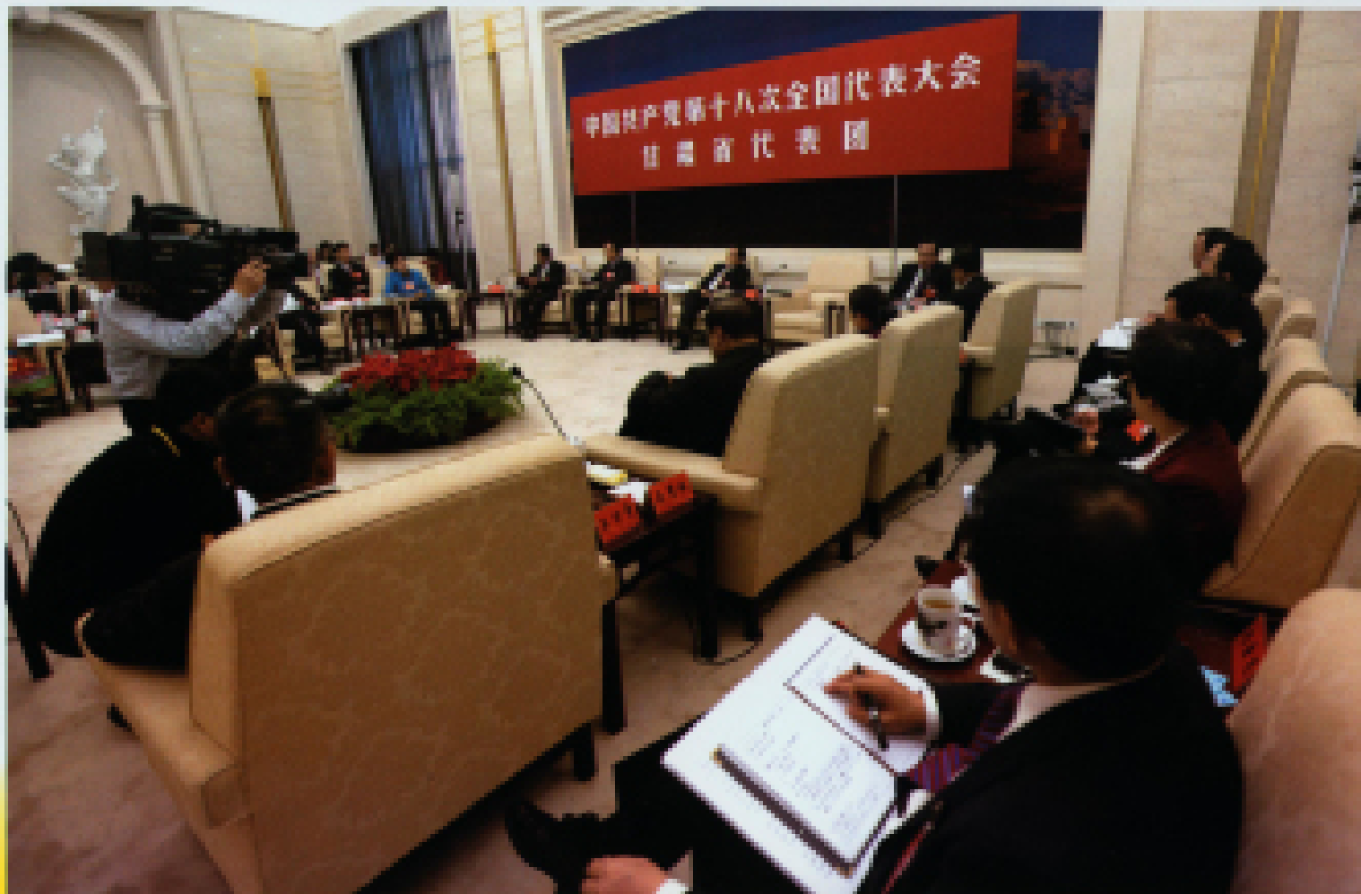
◀ 2012年11月8日,中国共产党第十八次全国代表大会在北京人民大会堂开幕,当日下午,甘肃代表团讨论大会报告。