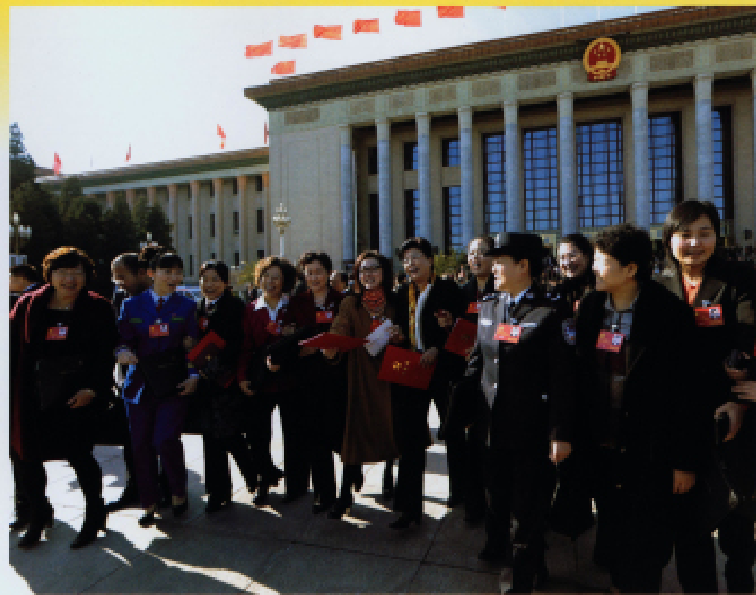
▲ 2012年11月14日,中国共产党第十八次全国代表大会在北京人民大会堂闭幕。图为来自各行各业的女代表列队走出大会堂。