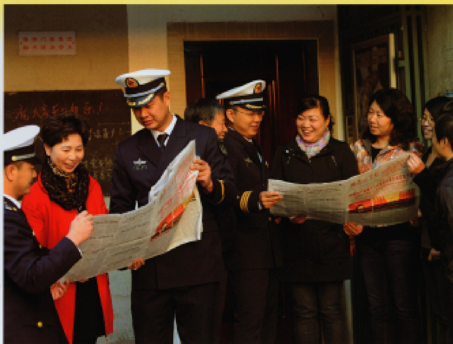
▲ 2012年11月12日,东海舰队某水警区开展“喜庆盛会励斗志、爱党爱国爱本职”系列庆祝活动,引导广大官兵把学习十八大精神转化到训练工作中去。